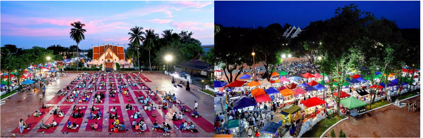
ค่ำ รับประทานอาหารค่ำ ณ ร้านอาหาร เข้าสู่ที่พัก น่าน บูติก รีสอร์ท หรือเทียบเท่า

มรดกภูมิปัญญาทางวัฒนธรรม การแสดงศิลปวัฒนธรรม การแสดงดนตรี นาฏศิลป์ของเด็กและเยาวชนและชาวบ้าน มี อาหารพื้นเมืองที่มาถึงเมืองน่านแล้วต้องได้ชิม